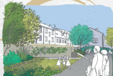
Zone de compostage