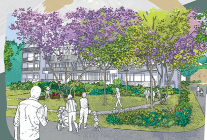
Carrés potagers sur-élevés