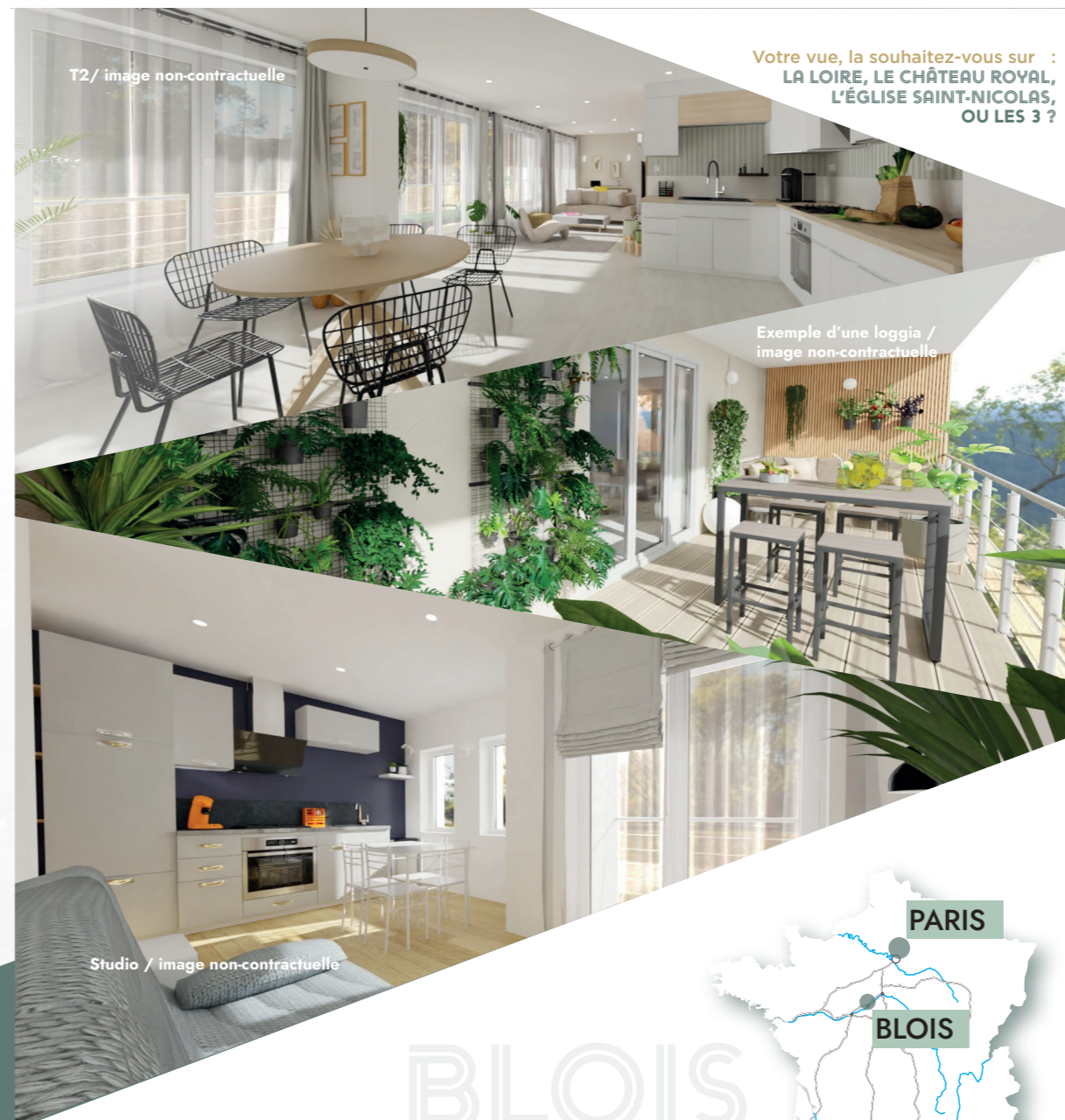
T2 / image non-contractuelle

Exploitez ces aménagements éco-conçus et pédagogiques pour un cadre de vie sain, harmonieux tout en contribuant à la préservation de l'environnement. Cette approche responsable et durable de l'aménagement paysager saura vous séduire et vous offrir une expérience de vie unique en accord avec les enjeux de notre époque.