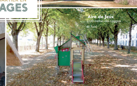
Aire de Jeux (100 mètres des Loggias du Foix)