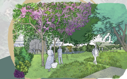
Espace de convivialité arboré

Vue du plan de masse du parc, des espaces de vie et des parkings